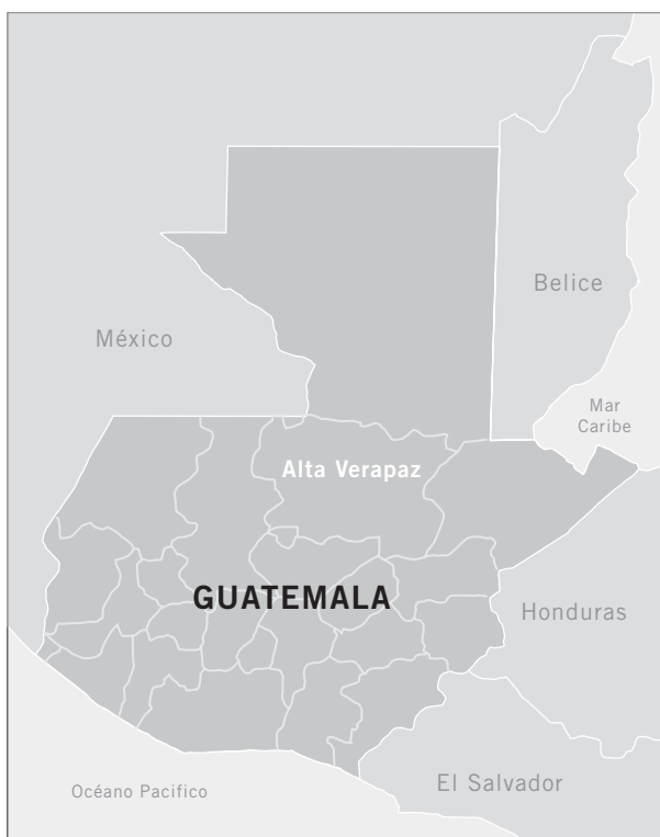
Mapa Guatemala: SEGEPLAN 2005

El Porvenir II es un caserío situado en el municipio de Chisec, departamento de Alta Verapaz, en el Norte de Guatemala.